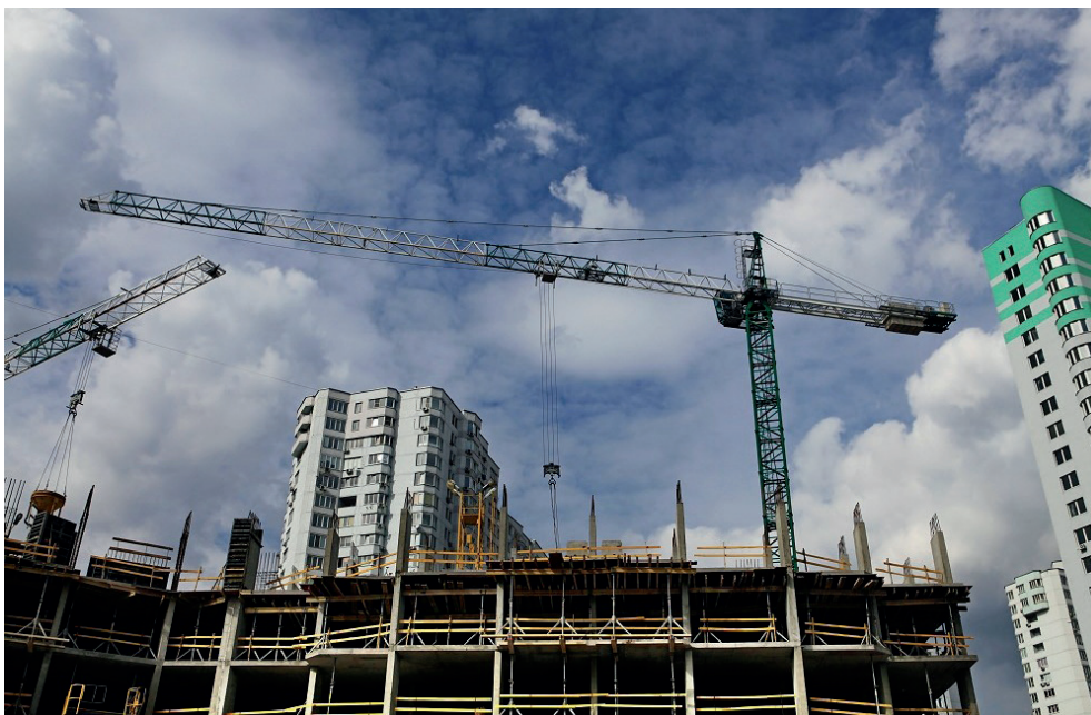
Ilustrační foto / Illustrative photo